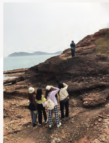
同學在海蝕平台拍照

下午3時30左右，大家再乘渡輪從吉澳返回馬料水碼頭，並在馬料水碼頭合影留念。至此，一天精彩的活動圓滿結束，期待下次學系舉辦的精彩活動！